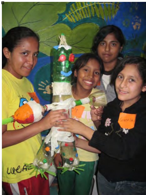
Taller de trabajo en grupo

Segundo, nos integramos a otra organización sin fines de lucro con el fin de expandir el impacto de los programas. Así colaboramos con la Fundación El Niño y la Bola en San José, Costa Rica para conducir el entrenamiento de liderazgo para las Voces de la Juventud con la participación de 45 mujeres jóvenes en el vecindario del Triangulo de la Solidaridad (San José). Esta colaboración no solamente nos permitió integrar más líderes jóvenes, sino también mejorar el curriculum a través de una retroalimentación positiva y perspectivas frescas.