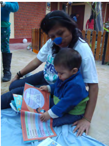
Proyecto de servicio en un orfanato

De regreso en Lima, ahora otro grupo de líderes jóvenes finalizaron el año con planes de conducir un proyecto de servicio en un orfanato cercano al barrio. Ellos usaron sus fondos para presentar un obra teatral para animar a los chicos y compartir con ellos una tarde de narración y juegos.