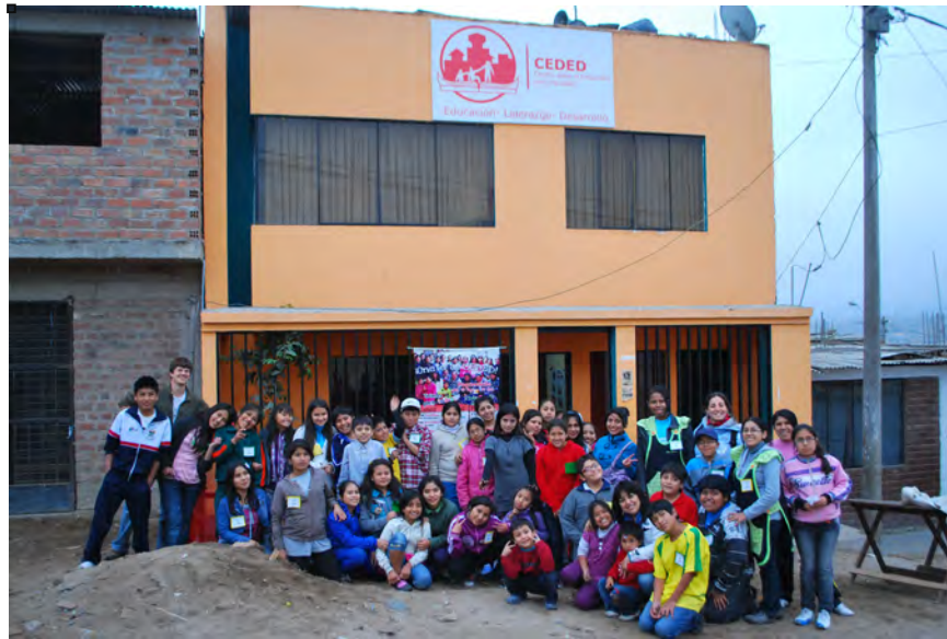
¡Muchísimas gracias por todo su apoyo!