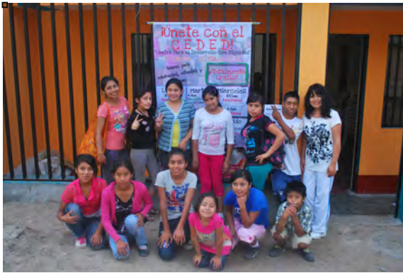
Voces de la Juventud

Segundo, nos integramos a otra organización sin fines de lucro con el fin de expandir el impacto de los programas. Así colaboramos con la Fundación El Niño y la Bola en San José, Costa Rica para conducir el entrenamiento de liderazgo para las Voces de la Juventud con la participación de 45 mujeres jóvenes en el vecindario del Triangulo de la Solidaridad (San José). Esta colaboración no solamente nos permitió integrar más líderes jóvenes, sino también mejorar el curriculum a través de una retroalimentación positiva y perspectivas frescas.