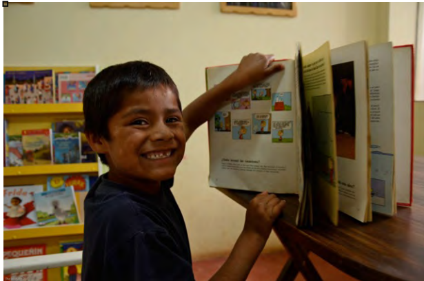
Educación comunitaria

El 2012 marca nuestro Segundo año de clases semanales de matemáticas para estudiantes que necesitan ayuda extra, así como es nuestro segundo año en la enseñanza del idioma Inglés a nuestro compañero el Colegio Buena Esperanza. Como una nueva iniciativa, actualmente recibimos a estudiantes que necesitan ayuda individualizada en sus tareas escolares durante las horas abiertas del centro de la comunidad; aproximadamente 50 estudiantes se benefician semanalmente de este programa de tutorías. Adicionalmente al soporte académico, 60 estudiantes participan en nuestros programas de arte y cultura, incluyendo lecciones de percusión y guitarra, pintura mural, cocina y teatro.